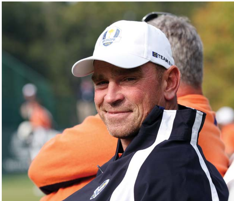
Vi fik da også sagt hej til Thomas Bjørn - måske et emne til Ryder Cup kaptajn i 2016?